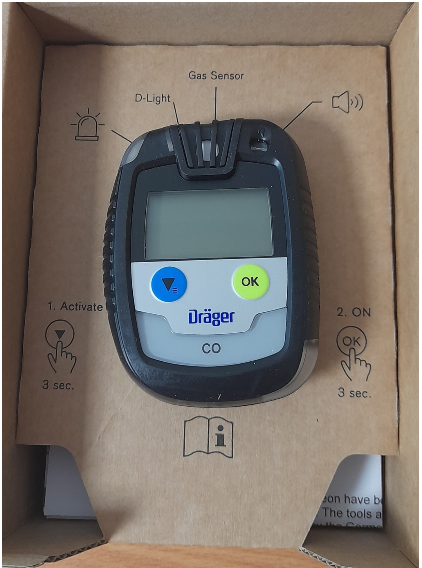
Nosze płachtowe, detektory jednogazowe, ciśnieniomierze elektroniczne oraz termometry Braun Thenoscan Pro już służą pacjentom w karetkach Krakowskiego Pogotowia Ratunkowego. Krakowskie Pogotowie